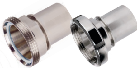
1 Raccordo Femmina