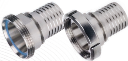
3 Raccordo Femmina